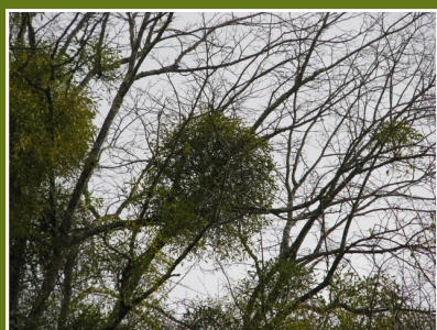
Boule de Gui

C'est à l'école primaire que nous avons tous appris son existence car les manuels d'histoire nous contaient que nos ancêtres, les Gaulois, avaient pour chefs spirituels de bons vieillards à barbe blanche, les druides, dont la principale occupation était de couper le gui à la cime des vieux chênes. En fait, le gui du chêne était un arbrisseau sacré parce que le Chêne était lui-même sacré : de tous les arbres de la forêt, c'était lui qui symbolisait le mieux la lumière et la force du soleil. Quant au Gui, c'était l'arbuste de la lune avec qui il a une ressemblance troublante : c'est le seul végétal parfaitement rond, comme un astre, il pousse en plein ciel parmi les branches, ne pose jamais pied à terre et ses baies blanches évoquent des petites lunes. C'est durant la période où les nuits sont les plus longues qu'il est cueilli, entre Noël et le 1 er de l'an.