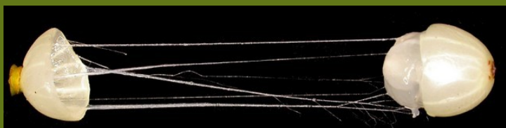
Baie visqueuse coupée en deux

Depuis l'Antiquité, il était connu pour ses vertus contre l'épilepsie les vertiges et les tumeurs. Aujourd'hui, ses préparations trouvent une indication dans l'hypertonie, l'hypotension et l'artériosclérose et il intervient en complément de certaines pratiques anticancéreuses.