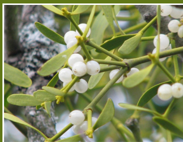
Feuilles et baies