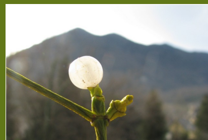
Petite lune ou baie de Gui ?

Au gui l'an neuf ! C'est sous sa boule, symbole de prospérité et de longue vie qu'on se souhaite les vœux le jour de l'an !