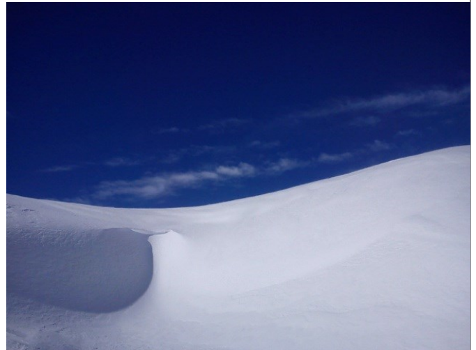
Col des Arazures