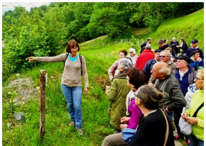
29 mai 2015 : présentation de l'aménagement à une bonne quarantaine de participants

Merci à tous les bénévoles (espèce en voie de disparition)