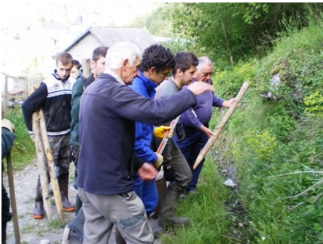
Mai 2015 : mise en place des plaques par les lycéens sous la houlette des bénévoles